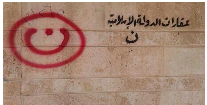
Nhà của Kitô hữu được đánh dấu chữ □