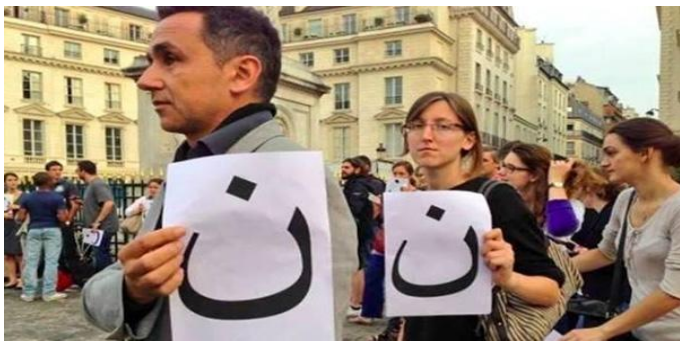
Biểu tình tuyên xưng “chúng tôi là Kitô hữu”

Các nhà hoạt động đấu tranh cho tự do tôn giáo đòi hỏi các chính quyền phương Tây hãy lưu ý đến thân phận của những Kitô hữu ở vùng Trung Đông. Nhiều nơi, những người biểu tình cũng đã mang những chiếc áo có chữ ܢ.